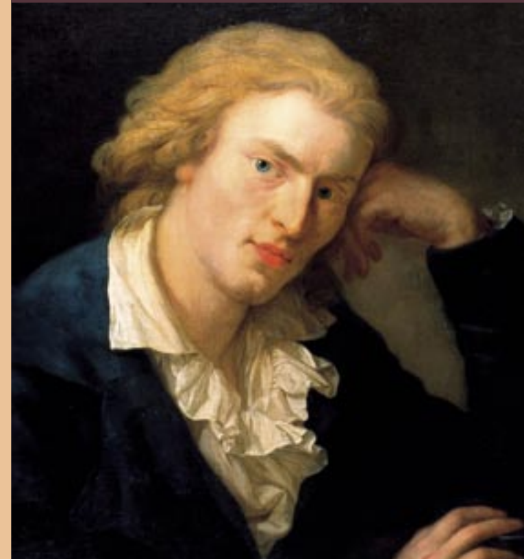
Schiller & Körner in Dresden e. V.